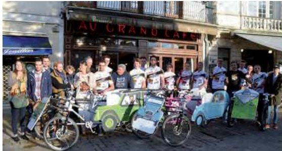
Bien qu'ils s'en défendaient, le jour de la présentation de leurs 3 équipages devant le Grand Café de Lyon, on a tout de suite vu que les Gold Coast Rider rêvaient d'une troisième victoire. Ils l'ont fait.

C'est le lycée du Clos Maire (5 ème ) qui termine premier équipage jeunes et Marey Smiley (8 ème ) qui est le premier équipage mixte. Au terme d'une course d'anthologie.