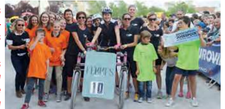
8 femmes, un vélo et des soutiens pour une belle cause.

La SLA se caractérise par une dégénérescence progressive des cellules nerveuses motrices avec destruction consécutive du faisceau pyramidal de la moelle épinière et des unités motrices associées ce qui provoque une paralysie progressive de l'ensemble de la musculature squelettique des membres, du tronc et de l'extrémité céphalique. Ce qui conduit à une paralysée complète.