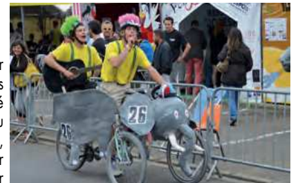
Les merveilleux Clowns du Cycle ont fait hurler de rire les spectateurs.

nera le prix de la Reconnaissance, à tous ces équipages, 8 Femmes et un vélo, Caramba'l, Shaddock Emergency ou Team Fire qui, à l'heure de la remise des prix, ont salué et remercié les autres équipes de stands voisins pour leur soutien ou leur aide.