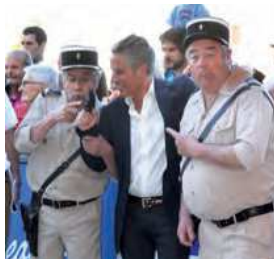
Des gendarmes du Rire à Marina Cohu, de belles animations tout au long des 24 Heures.

Et bien évidemment, on n'oubliera pas Roulzatic, le trio déjanté, véritable "âme" musicale, dans l'esprit et dans la note des 24 Heures, ni le