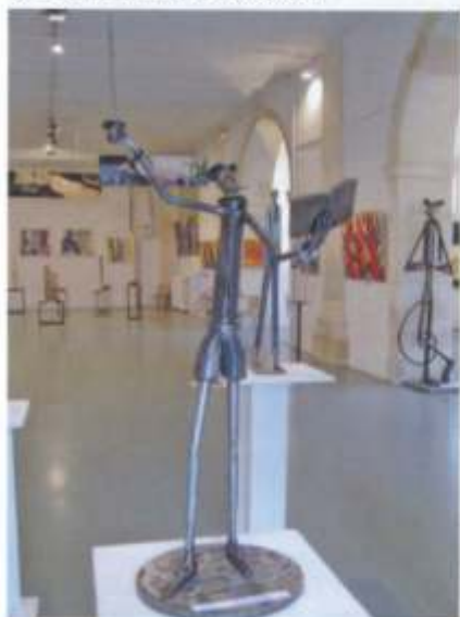
Chapelle de l'Oratoire Rue de Lorraine, Beaune

DU 23 JUIN AU 5 JUILLET 2015 DE 10 HEURES À 19 HEURES